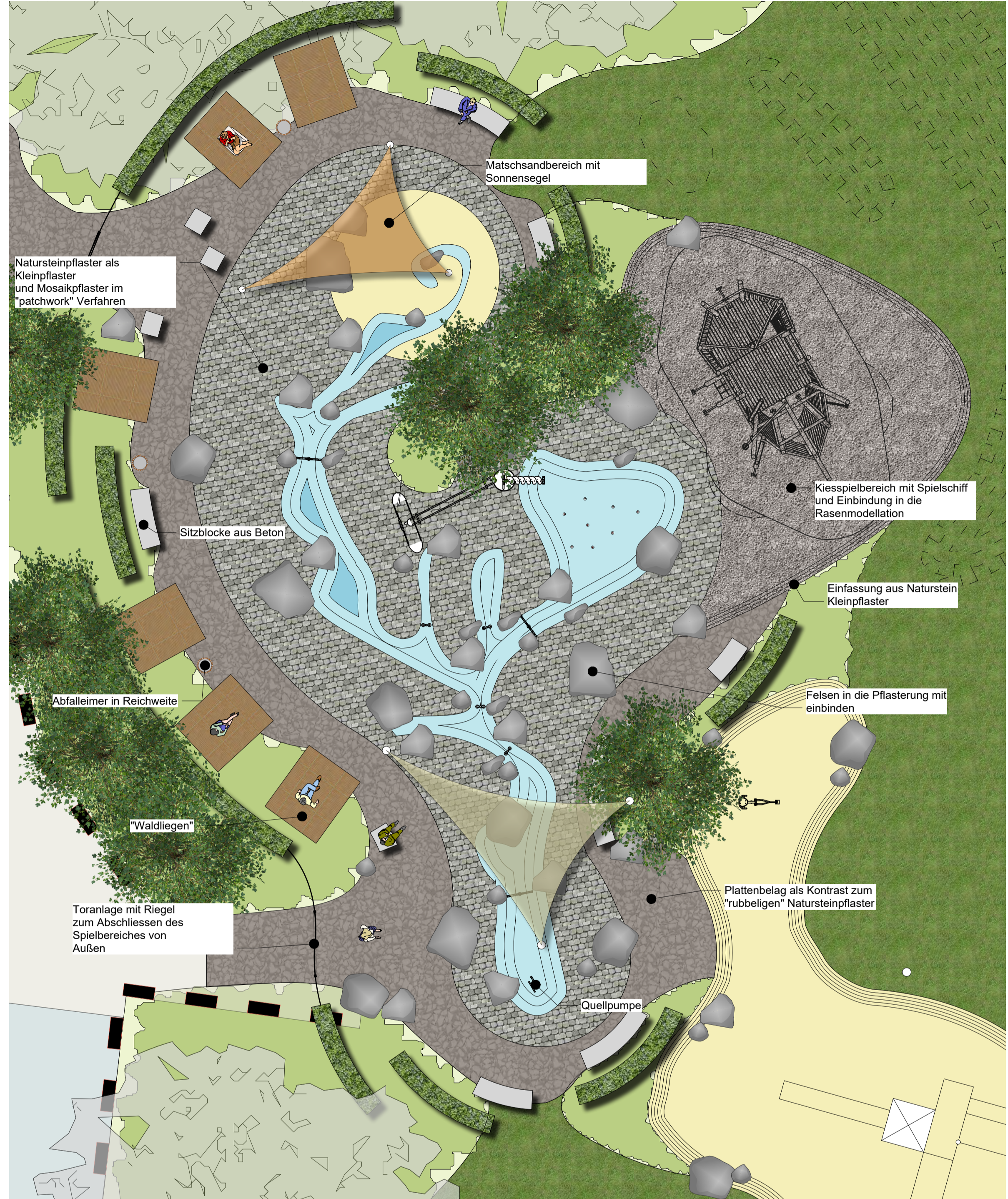
2 Entwurf Wassierspielplatz Maßstab: 1:100