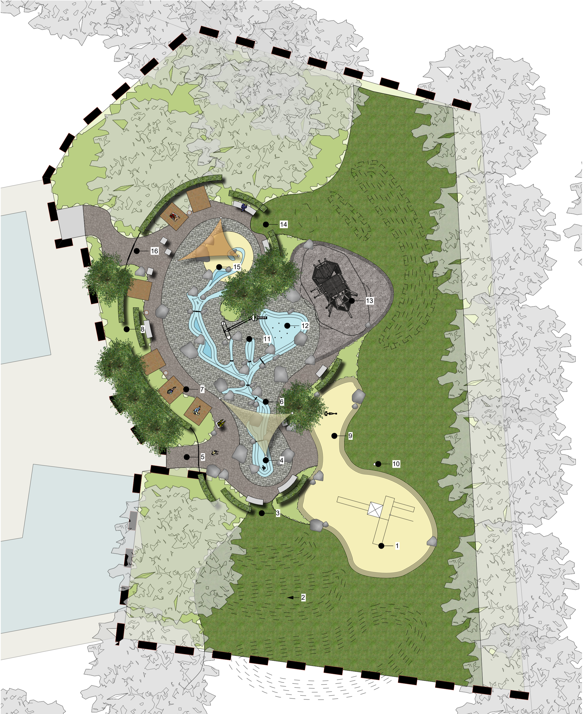
1 Vorentwurf Wassierspielbereich Maßstab: 1:200