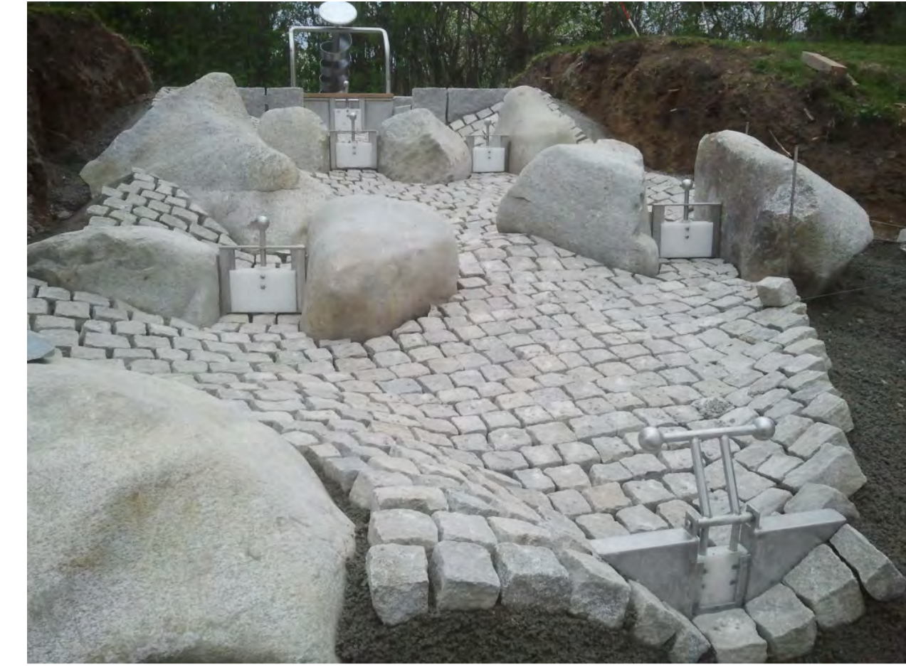
Beispielfoto Natursteinaufbau mit Staufstufen