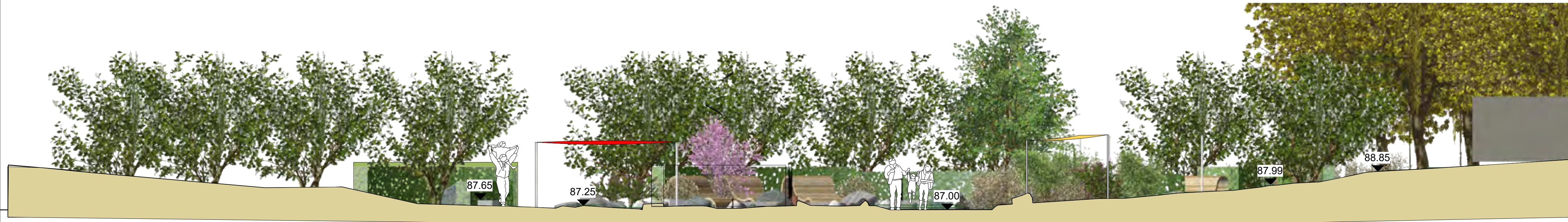
1 Längsschnitt AA' Maßstab: 1:100