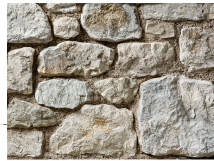
GEOPETRA Natursteinfassade für Mauern